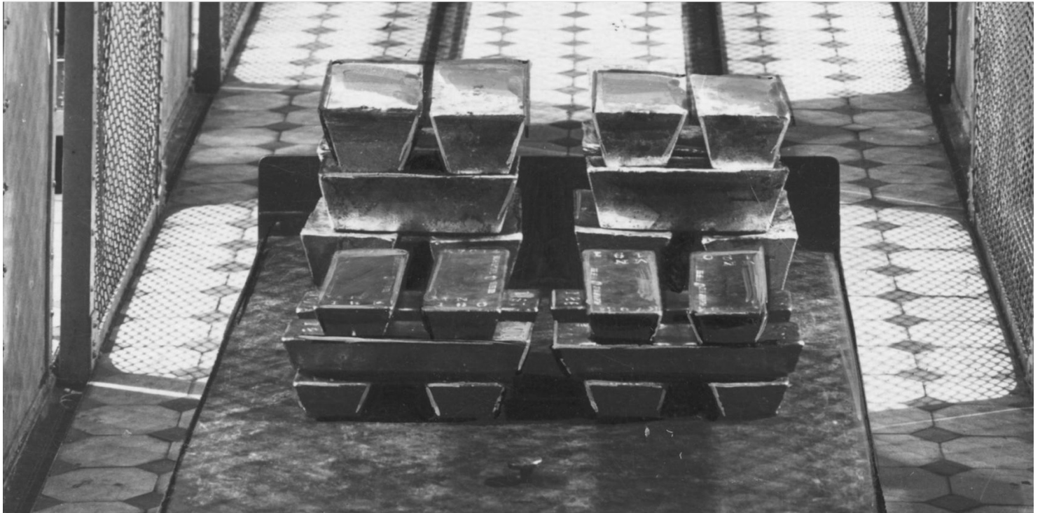
Skarbiec Banku Polskiego przy ulicy Bielańskiej 10 w Warszawie, kwiecień 1935 r.

https://przystanekhistoria.pl/pa2/tematy/wrzesien-1939/34756,Uratowac-zloto.html