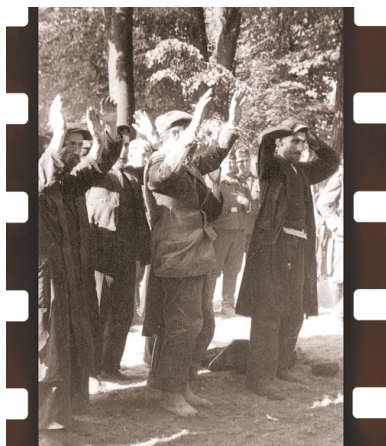
» Wielu Żydów zapędzonych do grabienia zwłok zostało później zastrzelonych przez żołnierzy niemieckich