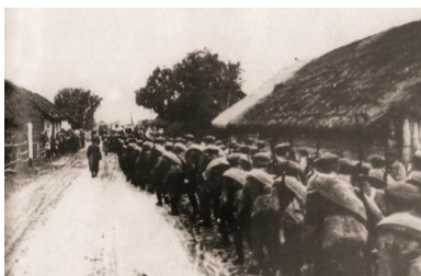
Armia Czerwona wkracza do wioski w rejonie Mołodeczna na Wileńszczyźnie. 17 września 1939 r.

Mobilizacja częściowa, zarządzona 23 marca 1939 r., objęła także część jednostek formacji, m.in. bataliony odwodowe: „Berezwecz”, „Żytyń”, „Snów” i „Snów I”, które po wzmocnieniu przerzucono w rejon: Żywiec–Chabówka–Nowy Targ, gdzie miały zamykać odcinek południowego pogranicza na przedpolu słabej Armii „Karpaty”. Zmobilizowano także osiem szwadronów kawalerii, które po przetransportowaniu w rejon Wielunia utworzyły ćwiczebny pułk kawalerii KOP. Po uzupełnieniu został on przekształcony w 1. Pułk Kawalerii KOP pod dowództwem płk. kaw. Feliksa Kopcia. Zmobilizowano także cztery kompanie saperów KOP („Wilejka”, „Stołpce”, „Stolin” i „Hoszcza”), które przerzucono na pogranicze zachodnie. W kwietniu zostały zmobilizowane kolejne bataliony odwodowe KOP („Wilejka” i „Wołożyn”), które dyslokowano w rejon Żywca. W maju z kompanii wydzielonych z Batalionów KOP „Sienkiewiczze” i „Sarny” utworzony został IV Batalion KOP „Hel”, który po przesunięciu na Półwysep Helski przeszedł do dyspozycji Morskiej Obrony Wybrzeża. W lipcu 1939 r. na pograniczu południowym zakończono formowanie 1. Pułku KOP „Karpaty” oraz w trybie alarmowym utworzono 2. Pułk KOP „Karpaty” złożony z Batalionów „Dukla” i „Komańcza”. Batalion KOP „Słobódka” po zmobilizowaniu w kwietniu wraz z baterią artylerii lekkiej KOP „Kleck” został dyslokowany na pogranicze