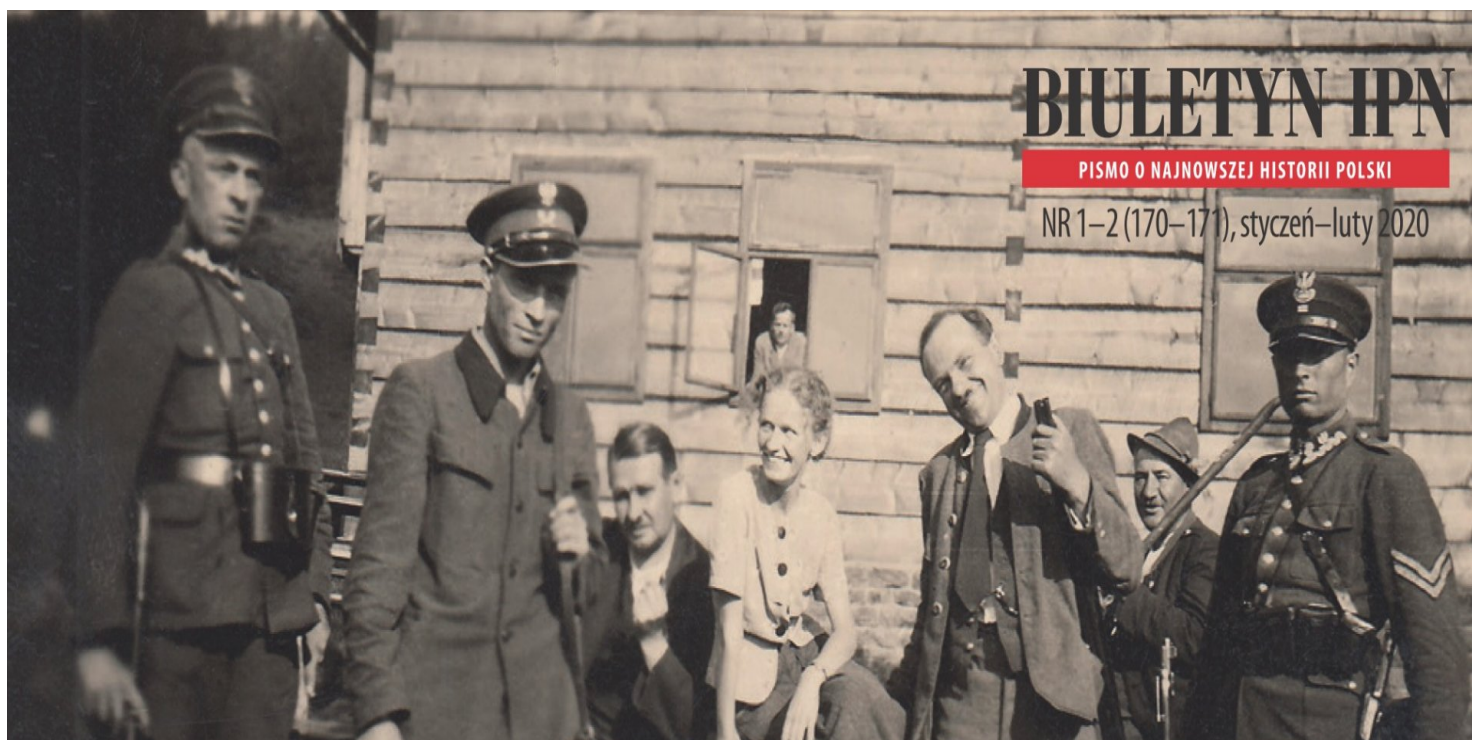
Czescy uchodźcy oraz pracownicy polskiej Straży Granicznej.

https://przystanekhistoria.pl/pa2/tematy/wrzesien-1939/64044,Legion-Czechow-i-Slovakow-w-Polsce.html