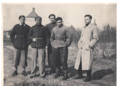
Grupa czeskich oficerów podczas

Już 3 września 1939 r. prezydent Ignacy Mościcki wydał dekret o utworzeniu Legionu Czechów i Słowaków w Wojsku Polskim. Dowódcą został gen. Lev Prchala. Był to pierwszy przypadek oficjalnego uznania czechosłowackiego ruchu oporu za granicą. Niemniej jednak sytuacja na froncie nie była obiecująca. Legion nie dysponował niemal żadnym sprzętem ani uzbrojeniem. 11 września 1939 r. jednostka w Leśnej pod dowództwem ppłk. Ludvíka Svobody rozpoczęła marsz na południe.