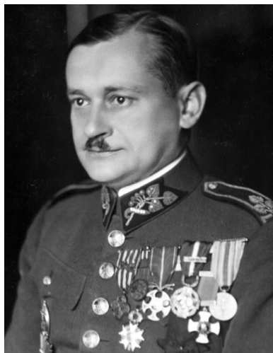
Gen. Lev Prchala.

Na zaistniałą sytuację zareagował również ruch oporu w „protektoracie”. Na północno-wschodnich Morawach powstała gęsta sieć osób zajmujących się przeprowadzaniem ludzi przez granicę: polityków, obywateli żydowskiego pochodzenia, a latem 1939 r. – przede wszystkim żołnierzy. Trasy działały niezawodnie – duża w tym zasługa m.in. kolejarzy. Jednym z ważnych czynników, które wzmocniły ruch oporu w „protektoracie”, było rozpoczęcie czeskich emisji radiowych z Katowic.