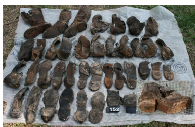
Bykownia - Cmentarzysko Ofiar Zbrodni Stalinowskich. Polskie obuwie wojskowe znalezione w grobie nr 152/06.

Z miejsca rodzi się pytanie: dlaczego szef NKWD polecił wywieźć w głąb ZSRS – ewidentnie na egzekucję, choć w jego rozkazie cel przetransportowania więźniów nie jest wskazany – „jedynie” 6 tys. więźniów? Przecież, jak podano wyżej, łącznie rozstrzelano ich więcej – 7 305. Wyjaśnienia tego fenomenu należy szukać w praktyce ciągłego przenoszenia aresztowanych – z więzienia do więzienia – przy czym generalny kierunek owego przetrzymywania był oczywisty: na wschód. W końcu marca 1940 r., kiedy Beria wydawał swój rozkaz, nie wszyscy więźniowie, których postanowiono zgładzić, znajdowali się wciąż w więzieniach tzw. Zachodniej Ukrainy i Zachodniej Białorusi. Część z nich została wywieziona na wschód już wcześniej. Wiadomo na przykład, że niektórzy z nich trafili do więzień w Chersoniu, a także w Nikołajewie koło Chersonia. Rozkaz uwzględniał zatem stan faktyczny – nie było sensu dysponowania przewozu 1 305 więźniów na terytorium sowieckie, skoro już się tam znajdowali.