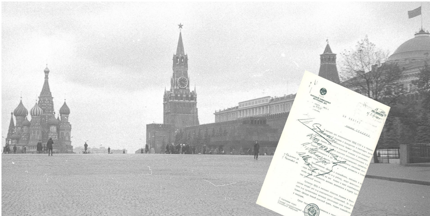
Kreml. Tu rosyjscy komuniści zdecydowali o ludobójczym wymordowaniu elit narodu polskiego.

https://przystanekhistoria.pl/pa2/tematy/wrzesien-1939/64350,Mord-na-wiezniach-mniej-znana-strona-Zbrodni-Katynskiej.html