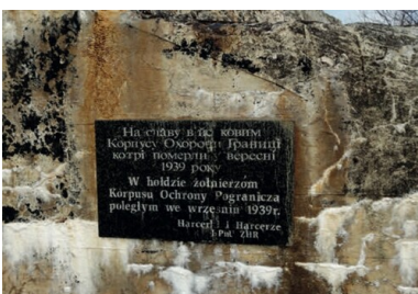
Tablica pamiątkowa poświęcona żołnierzom KOP na ścianie schronu w Tynnem. Fot. ze

Zanim doszło do agresji sowieckiej, żołnierze batalionu KOP „Sarny” czekali na przetrzucenie transportem kolejowym na front zachodni. Po zbombardowaniu przez Niemców 16 września stacji w Równem, a wkrótce przez Sowietów węzła w Sarnach ruch kolejowy na linii Sarny-Równe ustał.