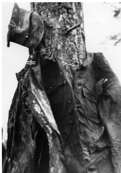
Zawieszony na drzewie mundur majora Pułku Szwoleżerów im. Józefa Piłsudskiego podczas ekshumacji w 1943 r.

na podobne opracowanie dotyczące Straży Więziennej.