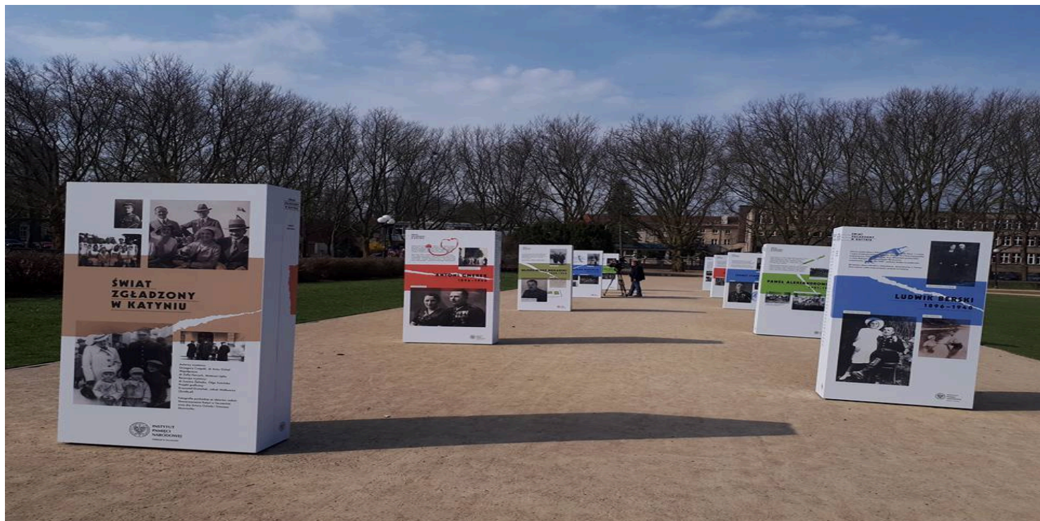
Wystawa IPN „Świat zgładzony w Katyniu” w Szczecinie, 2018 r.

https://przystanekhistoria.pl/pa2/tematy/wrzesien-1939/80279,Profil-ofiar-zbrodni-katynskiej.html