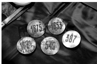
Odznaki służbowe zamordowanych polskich policjantów

Stawiając postulat dokładnego zliczenia strat poszczególnych formacji, już po zakończeniu prac nad listą ukraińską, spróbuję tu oszacować je na potrzeby artykułu. Straty owe wynosiły dla Policji Państwowej, Straży Więziennej i Straży Granicznej łącznie ponad 5,8 tys. funkcjonariuszy, w tym ponad 5,3 tys. funkcjonariuszy Policji Państwowej, ok. 400 Straży Więziennej i ok. 90 Straży Granicznej 27 . Ofiarami byli funkcjonariusze wszystkich stopni, również najniższych w hierarchii służbowej, np. posterunkowi policji. Po skompletowaniu biogramów z listy ukraińskiej, tylko fragmentarycznie uwzględnionej w tym wyliczeniu, liczba ta wzrośnie. Dotyczy to przede wszystkim bilansu strat Policji Państwowej, o którym już możemy powiedzieć, że przekroczył 6 tys. funkcjonariuszy.