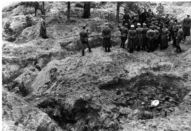
Ekshumacja zamordowanych przez NKWD oficerów Wojska Polskiego, Las Katyński, 1943 r.