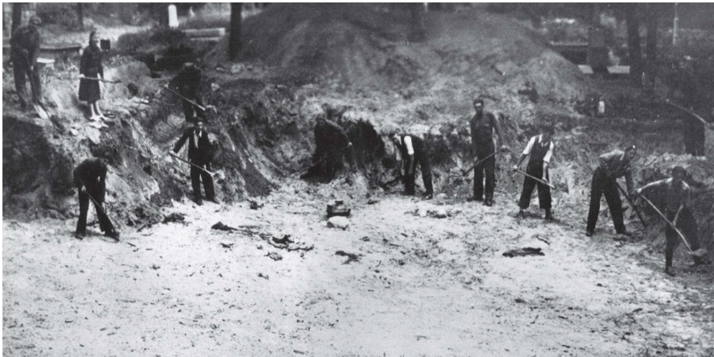
Zdjęcie pochodzi z albumu pamiątkowego "W hołdzie męczennikom za wiarę i ojczyznę. Paterek 1939 r."

https://przystanekhistoria.pl/pa2/tematy/wrzesien-1939/85840,Zbrodnia-Pomorska-Paterek.html