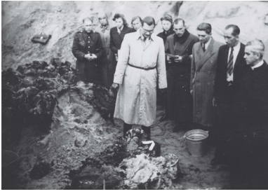
Zdjęcie pochodzi z albumu pamiątkowego "W hołdzie męczennikom za wiarę i ojczyznę. Paterek 1939 r."