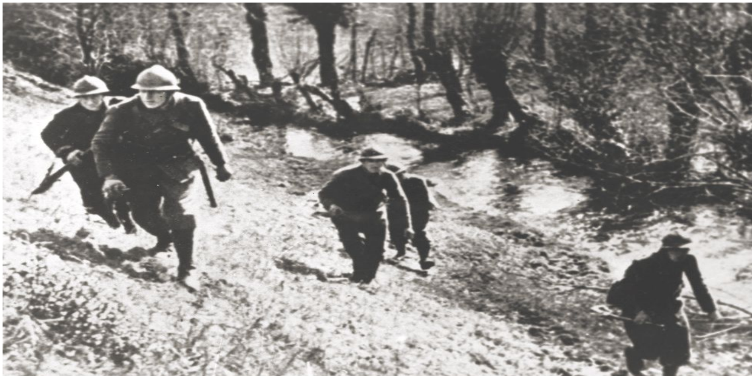
Polscy żołnierze w bitwie pod Kockiem

https://przystanekhistoria.pl/pa2/tematy/wrzesien-1939/86702,Kock-Ostatnia-bitwa-general-a-Kleeberga.html