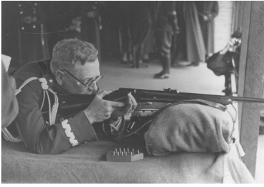
Generał brygady Franciszek Kleeberg oddaje honorowy strzał z karabinka sportowego - lata 30.

Po agresji sowieckiej do Kleeberga dotarł rozkaz Naczelnego Wodza mówiący o przekroczeniu granic neutralnych sąsiadów: Rumunii i Węgier. W tej sytuacji generał zdecydował się ściągnąć wszystkie swoje siły w rejon Kowla i stamtąd przebijać się do Rumunii.