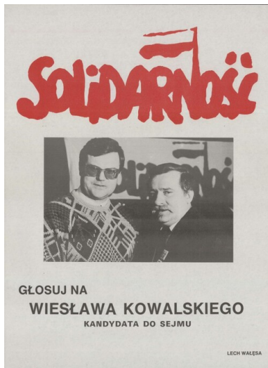
Plakat wyborczy Wiesława Kowalskiego