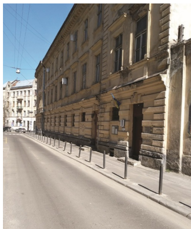
Budynek dawnego więzienia NKWD we Lwowie przy ul. Łąckiego.

internowanych Polaków był obóz nr 283 w Stalinogorsku.