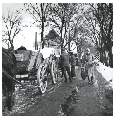
Aprovizacja obozu

W obozie znajdowało się pięć baraków, w tym trzy drewniane. Wysiedleńcy spali na drewnianych pryczach lub posadzkach pokrytych cienką warstwą słomy. Na jego terenie znajdował się też murowany budynek administracji niemieckiej oraz drewniane baraki z pomieszczeniami gospodarczymi. W budynku postawionym z bloków kamiennych umieszczono biura polskiej administracji obozu (utworzonej przez władze niemieckie), pomieszczenia do rejestracji i rewizji wysiedlonych oraz szpitalik obozowy. Na areszt przeznaczono mały drewniany barak. Pośrodku obozu znajdował się także duży plac. Cały teren otoczono potrójnym płotem z drutu kolczastego oraz płytkim rowem. W narożnikach umieszczono wieże wartownicze z reflektorami.