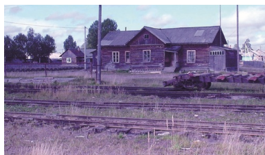
Stacja kolei wąskotorowej w osadzie Krutaja Osyp.

były na rano. Wstawaliśmy o godzinie pierwszej w nocy. I szliśmy z Mamusią do kuchni. Ja musiałam jej świecić taką żarówką ze świerka, bo tam światła nie było. Nacięto się wcześniej patyczków świerkowych i podpaliło. Jak się wchodziło do tej stołówki, to szczury jak koty latały. Ciągłe płakałam, bo się tak ich bałam. Potem przychodziły ruskie kucharki i gotowały zupę, żeby ludzie coś zjedli i w las. Wracali na wieczór do tych łagrów strasznych i zimnych. Palili w piecykach, przez całą noc, a dziury były w ścianach na wylot. Ubrania dali nam z worków. Na nogi łapcie z brzozy. Jak się przyszło do baraku, nogi były białe. Myśmy je rozcierali do czerwoności, boby się odmroziły. Boże, jak myśmy tam przeżyli?!