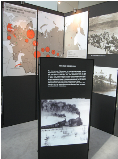
Wystawa IPN „Wygnańcy” („The Expelled” ) - prezentacja w Parlamencie Europejskim w Brukseli, 2008 r.