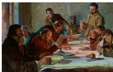
Wigilia na Syberii - obraz olejny autorstwa Jacka Malczewskiego. Dzieło znajduje się w zbiorach Muzeum Narodowego w Krakowie

Ale ona bardzo płakała i prosiła Boga. Klękała i modliła się, żebym się obudziła. I tak mną ruszała. A ja już nie miałam sił. Ale to Bóg dał, że się jakoś obudziłam. Siostra roztarła mi nogi i ręce, i twarz. Myślałyśmy, że nam ktoś pomoże, ale nikogo nie było, tylko pomoc Boża i Matki Boskiej. Siostra wzięła mnie, przytuliła, pocałowała, odśnieżyła i poszłyśmy dalej. Ona trochę mnie przytuliła do siebie, bo mnie było bardzo zimno. Mróz dalej ponad 30 stopni. Z oczu mnie płynęły łzy, które zamieniały się w kryształki lodu. Siostra prosiła mnie. Już niedaleko do Sondugi. Jeszcze tylko 5 kilometrów. Ale jej prośba mnie nie ratowała. Nie mogłam iść. To siostra znowu klęka na kolanach i prosi Boga, żeby Bóg pomógł i Matka Boska. I potem trochę dostałam siły i już szłam. Chyba Bóg wysłuchał płaczu mojej siostry i jej prośby. Szepnęłam do niej: – Jak dobrze, że jestem z tobą, trochę już mi lepiej.