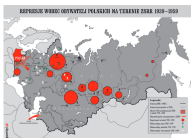
Mapa represji wobec obywateli