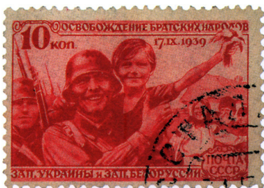
Sowiecki znaczek pocztowy upamiętniający wcielenie Zachodniej Ukrainy i Białorusi do ZSRR