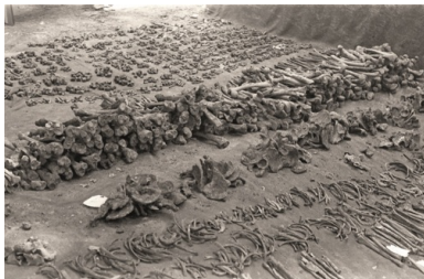
Posegregowane kości polskich oficerów podczas ekshumacji w Charkowie-Piatichatkach latem 1991 r.