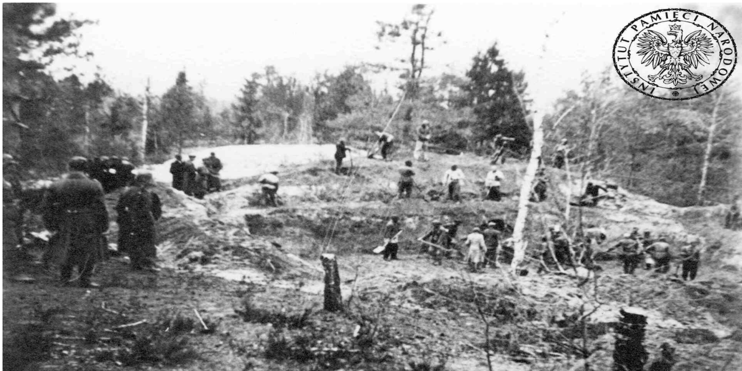
Pierwsza ekshumacja oficerów WP zamordowanych przez NKWD w Katyniu. Katyń, 16 IV 1943 r.

https://przystanekhistoria.pl/pa2/tematy/zbrodnia-katynska/101581,Kazimierz-Skarzynski-W-obronie-prawdy.html