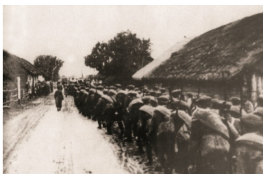
Armia Czerwona wkracza do wioski w rejonie Mołodeczna na Wileńszczyźnie. 17 września 1939 r.

Mobilizacja częściowa, zarządzona 23 marca 1939 r., objęła także część jednostek formacji, m.in. bataliony odwodowe: „Berezwecz”, „Żytyń”, „Snów” i „Snów I”, które po wzmocnieniu przerzucono w rejon: Żywiec–Chabówka–Nowy Targ, gdzie miały zamykać odcinek południowego pogranicza na przedpolu słabej Armii „Karpaty”. Zmobilizowano także osiem szwadronów kawalerii, które po przetransportowaniu w rejon Wielunia utworzyły ćwiczebny pułk kawalerii KOP. Po uzupełnieniu został on przekształcony w 1. Pułk Kawalerii KOP pod dowództwem płk. kaw. Feliksa Kopcia. Zmobilizowano także cztery kompanie saperów KOP („Wilejka”, „Stołpce”, „Stolin” i „Hoszcza”), które przerzucono na pogranicze zachodnie. W kwietniu zostały zmobilizowane kolejne bataliony odwodowe KOP („Wilejka” i „Wołożyn”), które dyslokowano w rejon Żywca. W maju z kompanii wydzielonych z Batalionów KOP „Sienkiewicze” i „Sarny” utworzony został IV Batalion KOP „Hel”, który po przesunięciu na Półwysep Helski przeszedł do dyspozycji Morskiej Obrony Wybrzeża. W lipcu 1939 r. na pograniczu południowym zakończono formowanie 1. Pułku KOP „Karpaty” oraz w trybie alarmowym utworzono 2. Pułk KOP „Karpaty” złożony z Batalionów „Dukla” i „Komańcza”. Batalion KOP „Słobódka” po zmobilizowaniu w kwietniu wraz z baterią artylerii lekkiej KOP „Kleck” został dyslokowany na pogranicze