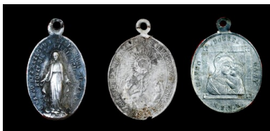
Bykownia - Cmentarzysko Ofiar Zbrodni Stalinowskich. Medaliki katolickie, z napisami w języku polskim znalezione w grobach nr 144/06 i 148/06.