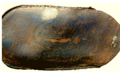
Bykownia - Cmentarzysko Ofiar Zbrodni Stalinowskich. Skórzane etui na okulary z napisem: K. Zieliński, Mechanik i Optyk, Kraków, grób nr 118/06.