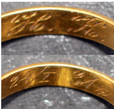
Bykownia - Cmentarzysko Ofiar Zbrodni Stalinowskich. Złota obrączka znaleziona podczas badań prowadzonych w 2007 roku z wygrawerowanym napisem „H.K.24/I 31 r.” - grób 145/06.