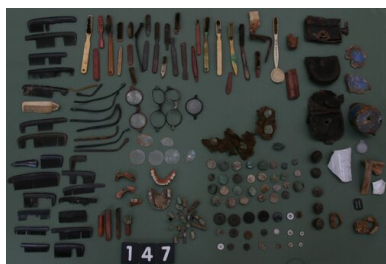
Bykownia - Cmentarzysko Ofiar Zbrodni Stalinowskich. Zespół przedmiotów wydobytych z grobu nr 147/06.

Decyzją Biura Politycznego WKP(b) i rządu sowieckiego z 5 marca 1940 r. zamordowano polskich żołnierzy, policjantów i funkcjonariuszy publicznych, ale także deportowano na wschód ich rodziny. Przedstawiciele władzy sowieckiej bez wahania, z obojętnością, jednym postanowieniem usunęli niewygodne dla siebie politycznie elementy, aby uniemożliwić odrodzenie polskiego państwa. W uzasadnieniu wniosku o rozstrzelanie ponad 25 000 tysięcy Polaków, Ławrientij Beria napisał, że są oni „zatwardziały i nieprzejednany wrogami władzy sowieckiej”. Byli ludźmi, mieli rodziny, krewnych, zniszczono ich życie, pozbawiono wszystkiego co najdroższe. Nam przez kolejne pięćdziesiąt lat nie pozwolono nawet myśleć o nich i ich wspominać. Odebrano nam wszystko.