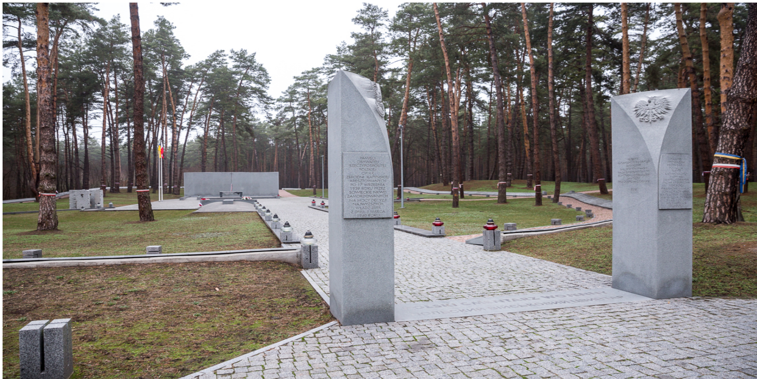
Polski Cmentarz Wojenny w Bykowni.

https://przystanekhistoria.pl/pa2/tematy/zbrodnie-katynskie/63714,Na-zawsze-pozostana-w-naszej-pamieci-Slady-ofiar-zbrodni-katynskiej-na-cmentarzu.html