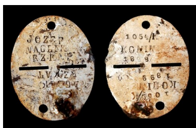
Bykownia - Cmentarzysko Ofiar Zbrodni Stalinowskich. Wojskowy znak tożsamości, należący do starszego sierżanta Józefa Naglika, grób nr 174A/06.

W ciągu 10 miesięcy prac terenowych wykonano 5 tysięcy sondaży wiertniczych w celu zlokalizowania wszystkich grobów oraz rekonstrukcji infrastruktury cmentarza. Na ich podstawie wyznaczono 217 grobów. Przeprowadzone badania i analizy pozwoliły stwierdzić, że w 70 z nich pochowano polskie ofiary zbrodni katyńskiej. O tym, że pochowano tu Polaków jednoznacznie świadczyły odkryte w grobach przedmioty. Były to fragmenty polskich mundurów wojskowych z 20-lecia międzywojennego, liczne guziki mundurowe, buty wojskowe, polskie monety, medaliki, krzyżyki, plakietki, przedmioty osobiste, takie jak grzebień, szczoteczki, okulary, kubki metalowe. Na wielu z nich odczytano nazwy polskich firm. Podczas prowadzenia badań archeologicznych i ekshumacji wyselekcjonowano do ekspertyzy 3970 przedmiotów, których stan zachowania na to pozwalał. Wśród nich było kilka takich, na których odczytano nazwiska polskich ofiar z ukraińskiej listy katyńskiej. W czternastu grobach uznanych za polskie znaleziono przedmioty należące do kobiet. Niestety, żaden z nich nie pozwala na identyfikację właścicielki.