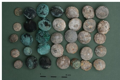
Bykownia - Cmentarzysko Ofiar Zbrodni Stalinowskich. Polskie guziki mundurowe znalezione w grobie nr 152/06.

Gorbaczowa, dwóch teczek akt dotyczących zbrodni katyńskiej, w tym, sporządzonych w okresie od kwietnia do maja 1940 r., imiennych list wywózkowych polskich jeńców z obozów w Kozielsku i Ostaszkowie oraz spisu imiennych akt ewidencyjnych jeńców "ubytych" z obozu w Starobielsku. Działalność państwa polskiego po 1989 r. w dochodzeniu do prawdy o zbrodni, ale także w przywracaniu pamięci, godnych pochówków i upamiętnianiu ofiar była i jest prowadzona z inicjatywy i przy wsparciu Rodzin Katyńskich. Rodzin, które przetrwały i żyją nadzieją na odnalezienie śladów ich najbliższych. Jedną z części postępowań ujawnienia prawdy o zbrodni katyńskiej były ekshumacje, w których brali udział polscy specjaliści. Dziś już wiemy, że prace prowadzono na cmentarzach NKWD w Katyniu, Charkowie-Piatichatkach, Miednoje i Bykowni. W momencie rozpoczynania prac, w latach 90-tych XX wieku, tej pewności nie było. Wyniki ekshumacji jednoznacznie wskazały, że są tam pochowani zamordowani w 1940 r. polscy jeńcy wojenni z obozów w Kozielsku, Starobielsku i Ostaszkowie. Prace w Katyniu, Charkowie-Piatichatkach i Miednoje, zakończyły się otwarciem w tych miejscach w 2000 r. Polskich Cmentarzy Wojennych.