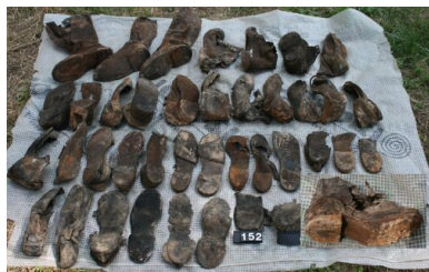
Bykownia - Cmentarzysko Ofiar Zbrodni Stalinowskich. Polskie obuwie wojskowe znalezione w grobie nr 152/06.

Prowadzone na terenie cmentarza w Bykowni, w latach 2002-2012, badania miały dwa wymiary. Pierwszy, czysto naukowy – jego celem było rzetelne odtworzenie faktów. Drugi wymiar miał znaczenie emocjonalne. Jego wartością było odnalezienie miejsca pochówku ofiar, o których pamięć miała zginąć na zawsze. Dlatego odnalezione w Bykowni przedmioty są równocześnie dowodami zbrodni i relikwiami. Każdy z tych wydobytych z ziemi artefaktów jest świadkiem i jednocześnie dowodem zbrodni popełnionej na polskich obywatelach – żołnierzach i cywilach – skazanych na śmierć decyzją Biura Politycznego WKP(b) i rządu sowieckiego z 5 marca 1940 r., a mordowanych w Kijowie.