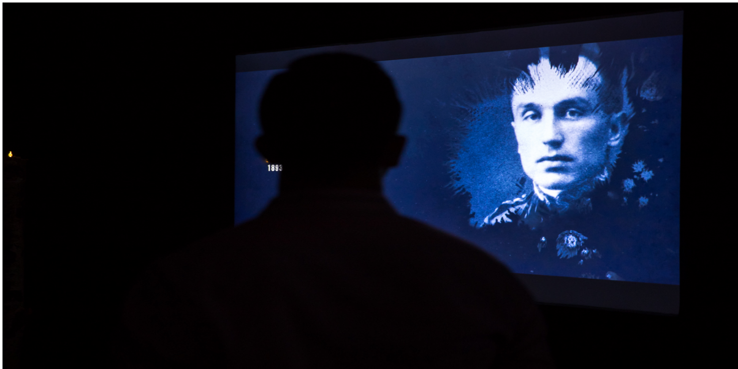
Prezentacja wystawy multimedialnej

https://przystanekhistoria.pl/pa2/tematy/zbrodniea-katynska/77449,Na-czas-wigilijnej-refleksji-Drogowskazy-po-zostawione-przez-Ofiary-tzw-decyzji-k.html