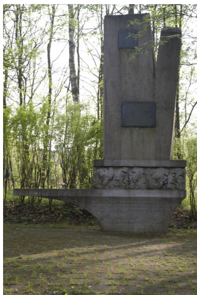
Pomnik ofiar egzekucji na