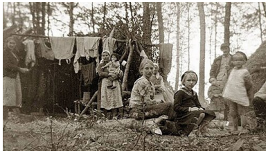
Wieś Przebraże w pow. łuckim - uchodźcy w bazie samoobrony.