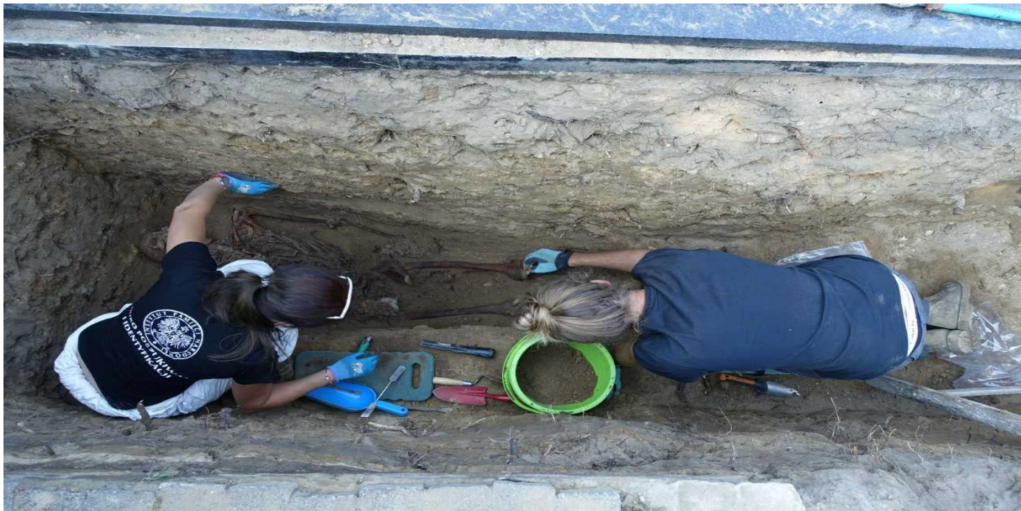
Archeolodzy z BPO IPN podczas prac ekshumacyjnych w Wieluniu, wrzesień 2018 r.

https://przystanekhistoria.pl/pa2/tematy/zbrodnie-komunistyczne/103149,Wielunska-Laczka.html