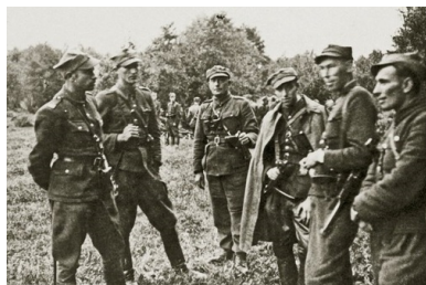
Mjr Zygmunt Szendzielarz Łupaszka (pierwszy z lewej) ze