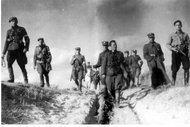
Mjr Zygmunt Szendzielarz Łupaszka (pierwszy z lewej) na czele 5 Brygady Wileńskiej AK