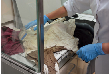
Sprawdzanie stanu zachowania