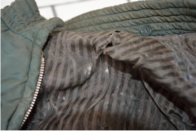
Fragment kurtki Zygmunta Toczka