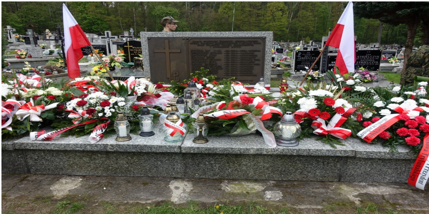
Mogiła dwunastu żołnierzy Konspiracyjnego Wojska Polskiego na cmentarzu w Bąkowej Górze, 2017 r.

https://przystanekhistoria.pl/pa2/tematy/zbrodnie-komunistyczne/63438,Proces-siedemnastu-w-Radomsku-7-maja-1946-r.html