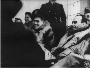
Polscy piloci przed startem. Kadr z filmu „Biały Orzeł”.