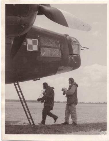
Polscy lotnicy wsiadający do bombowca Vickers Wellington.

Druga faza Bitwy rozpoczęła się 8 sierpnia 1940 roku, kiedy to Luftwaffe rozszerzyła swe działania o ataki skierowane przeciwko brytyjskiemu lotnictwu oraz portom. Niemcy dążyli do zniszczenia lotnictwa RAF. Niemieckie bombowce prowadziły w tym czasie nocne ataki na cele wojskowe, które były preludium późniejszego nocnego Blitzu.