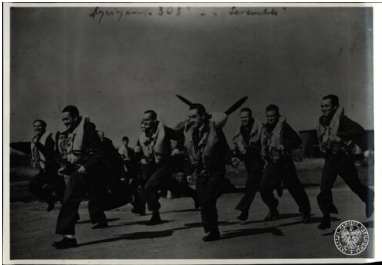
Piloci Dywizjonu 303 biegnący do samolotów.