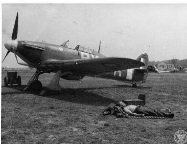
Samolot Hawker Hurricane Mk. I - podstawowe wyposażenia polskich dywizjonów myśliwskich w okresie Bitwy o Anglię.