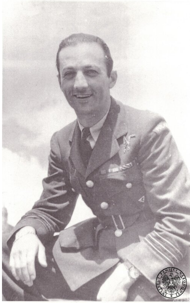
Pil. TADEUSZ SAWICZ - dowca 315 Dywizjonu

Tadeusz Władysław Sawicz, uczestnik Bitwy o Anglię. W późniejszym okresie dowódca Dywizjonu 315.