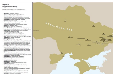
Mapa nr 1. Łagry na terenie Ukrainy

Łagry na terenie ZSRS, do których trafiali deportowani Górnoszlązacy. Oprac. merytoryczne D. Węgrzyn, oprac. graficzne B. Nikonowicz. Za: Deportacje Górnoszlązaków do ZSRS w 1945 roku. Teka edukacyjna , IPN Oddział w Katowicach, 2020, wydanie II rozszerzone i zaktualizowane