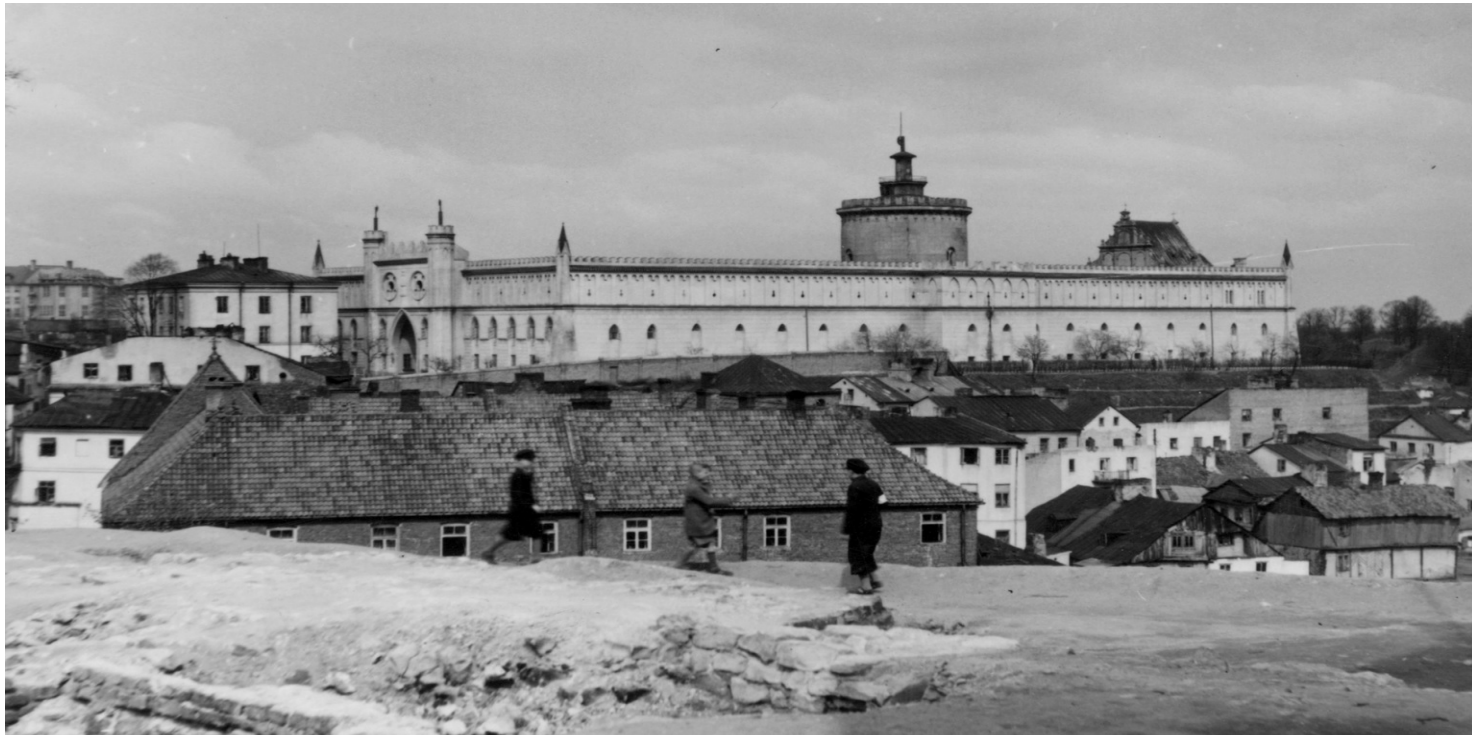
Zamek w Lublinie - widok zewnętrzny z lat II wojny światowej.

https://przystanekhistoria.pl/pa2/tematy/zbrodnie-komunistyczne/92888,Ciaglosc-zbrodni-egzekucje-AK-owcow-w-lubelskim-zamku.html