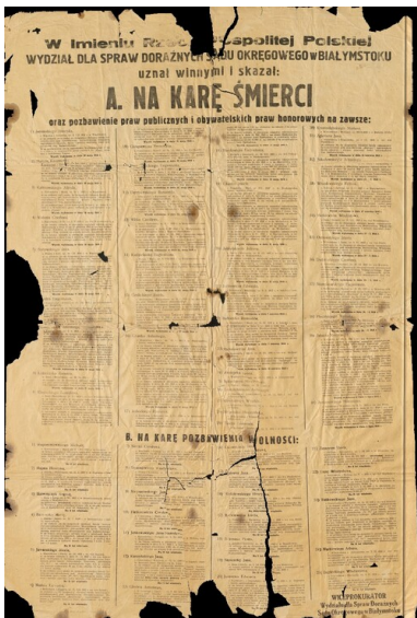
Afisz zbiorczy za maj i czerwiec 1946 r. z nazwiskami 40 osób skazanych na karę śmierci przez sędziego Włodzimierza Ostapowicza.

W okresie od 8 lutego do 30 czerwca sąd doraźny w Białymstoku pod przewodnictwem Ostapowicza rozpatrzył