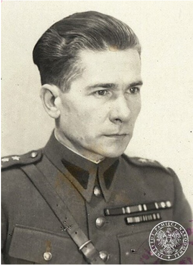
Włodzimierz Ostapowicz.