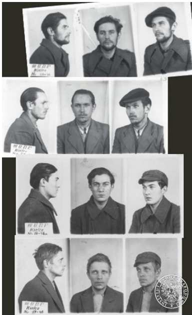
Zdjęcia sygnalityczne członków podziemia zbrojnego skazanych na śmierć przez mjr. S. Baraniuka 7 maja 1946 r. Wyrok wykonano trzy dni później.