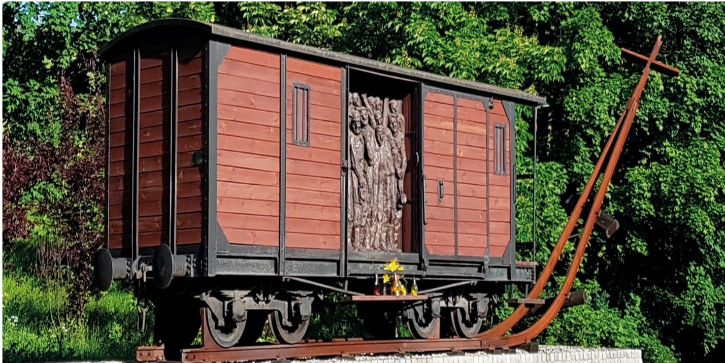
Pomnik Tragedii Górnośląskiej w Miechowicach (Bytom) – widok ogólny.

https://przystanekhistoria.pl/pa2/tematy/zbrodnie-komunistyczne/98262,Deportacje-Gornoslazakow-do-ZSRS-w-1945-roku.html