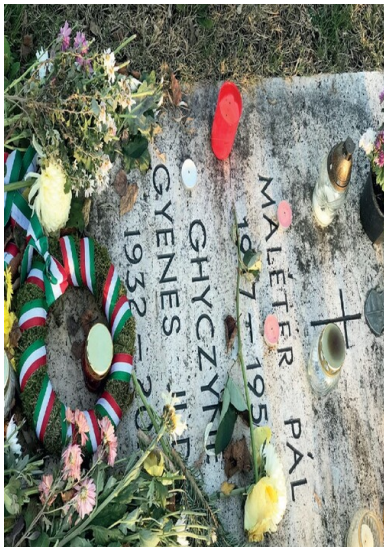
Grób Pála Malétera. Fot.: