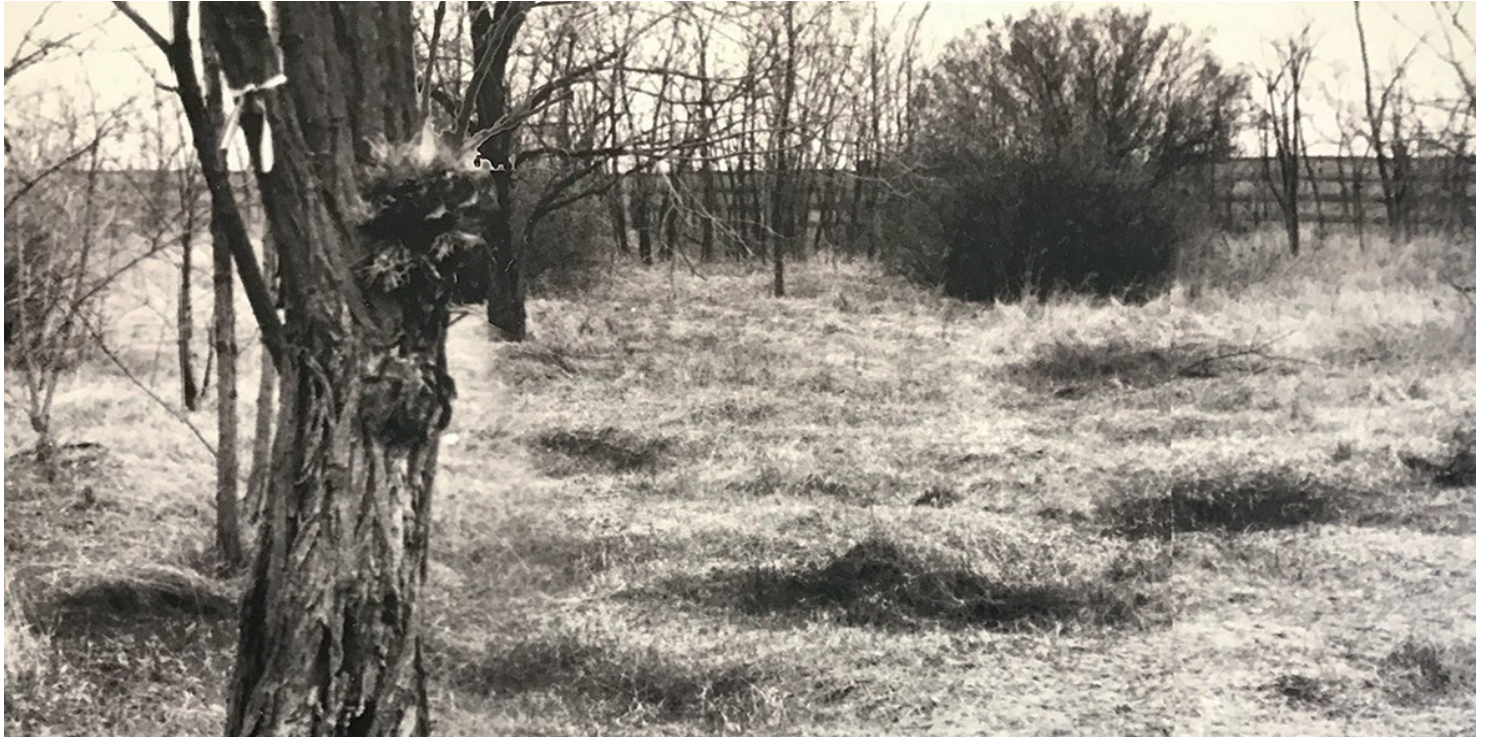
Pierwotny teren kwatery 301.

https://przystanekhistoria.pl/pa2/tematy/zbrodnie-komunistyczne/98436,Kwatera-301-panteon-wegierskiego-narodowego-meczenstwa.html