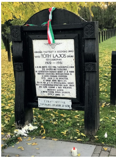
Grób Lajosa Tótha.