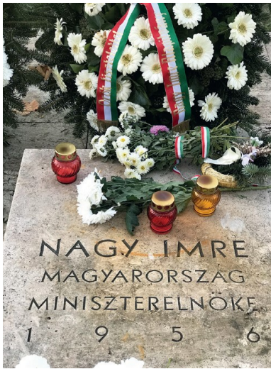
Grób Imrego Nagya.