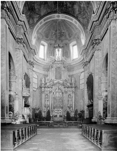
Wnętrze katedry pw. św. Jana Chrzyciela i św. Jana Ewangelisty w Lublinie w latach II wojny światowej.

Kiedy w lipcu 1949 r. w katedrze lubelskiej dostrzeżono „krwawą łzę” spływającą z wizerunku Matki Boskiej Częstochowskiej, wokół katedry zaczęły gromadzić się tłumy. Podobne wydarzenia identyfikowane jako cudy, gromadzące wiernych jednej lub kilku parafii, stanowiły reakcję na próby ateizacji społeczeństwa. Odpowiedzią władz stawały się akcje siłowego rozpędzania zgromadzeń i represje wobec wiernych, którzy w nich uczestniczyli.