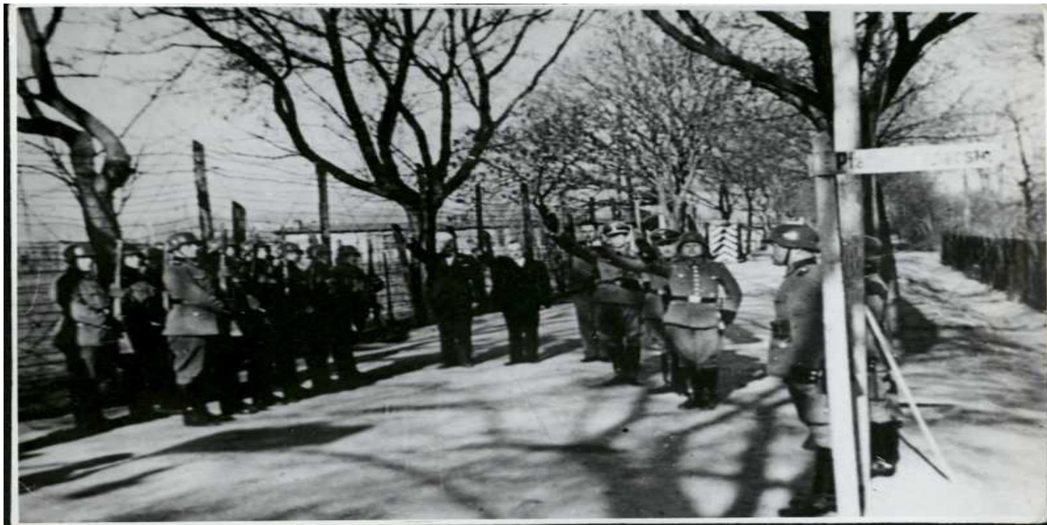
Obchody święta 1 Maja przez załogę niemieckiego obozu przy ul. Głównej (fot. z zasobu IPN)

https://przystanekhistoria.pl/pa2/tematy/zbrodnie-niemieckie/103437,Lager-Glowna-1939-1940.html