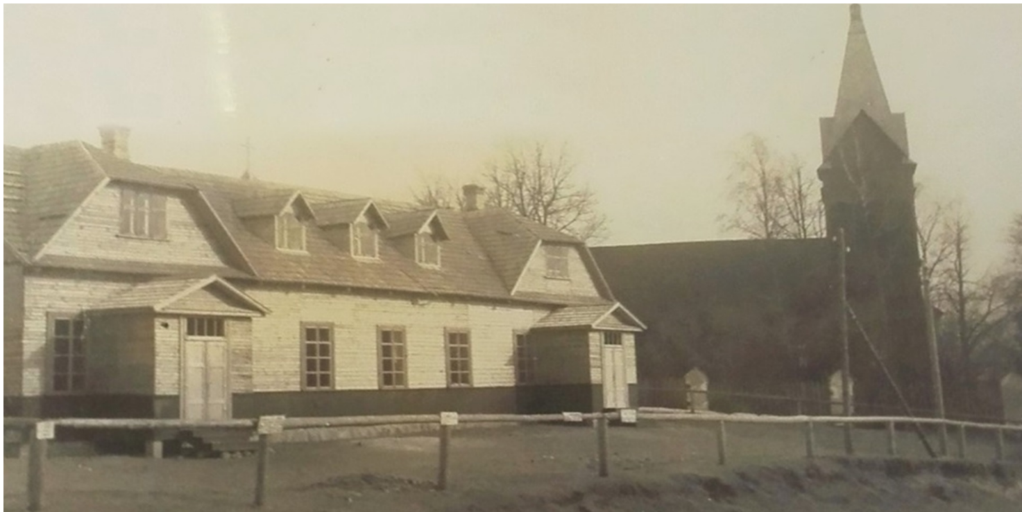
Dom Ludowy i kościół w Połukniu.

https://przystanekhistoria.pl/pa2/tematy/zbrodnie-niemieckie/103596,Zbiorowa-egzekucja-odwetowa-dokonana-25-czerwca-1941-r-w-Polukniu.html