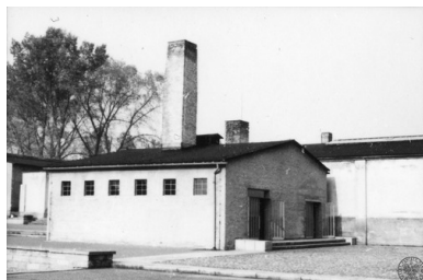
Budynek krematorium w KL Ravensbrück

W FKL Ravensbrück były również osadzone Rosjanki, Francuzki, Holenderki, Żydówki. Ogólnie obozowe piekło przeszło ok. 130 tysięcy osób różnych narodowości.