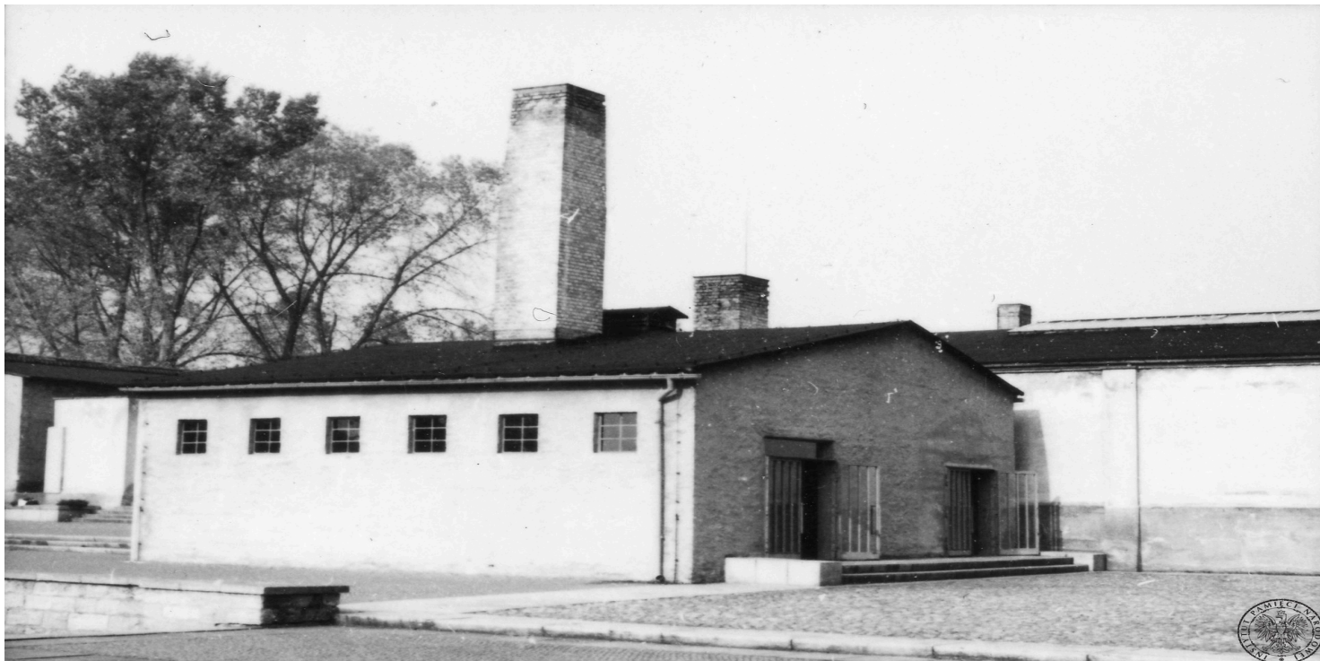
Budynek krematorium w KL Ravensbrück

https://przystanekhistoria.pl/pa2/tematy/zbrodnie-niemieckie/104437,Frauen-Konzentrationslager-Ravensbrck-Pieklo-na-ziemi.html