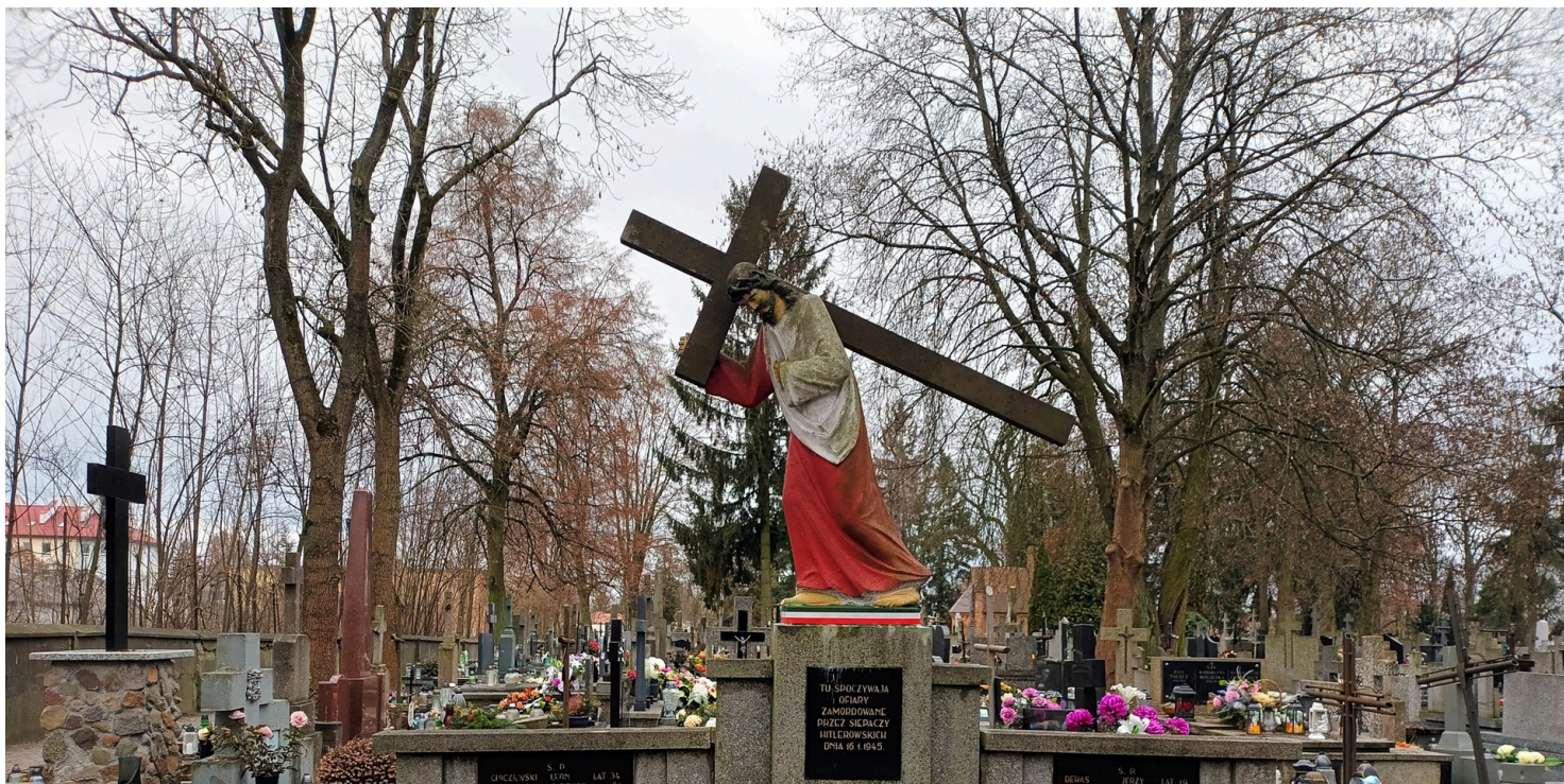
Cmentarz parafialny w Ciechanowie.

https://przystanekhistoria.pl/pa2/tematy/zbrodnie-niemieckie/105138,Mord-w-Ciechanowie.html