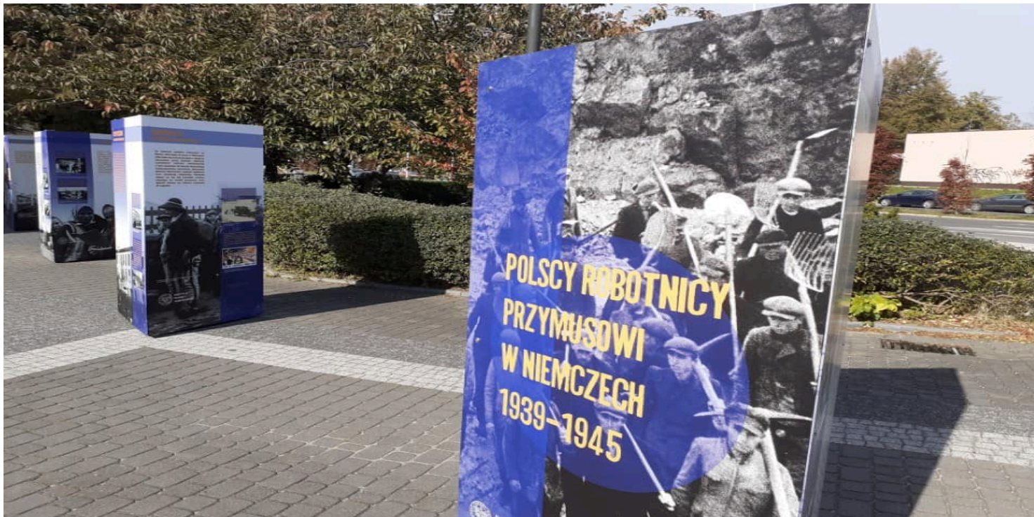
Wystawa "Polscy robotnicy przymusowi w Niemczech 1939-1945" - Łódź, 12-29.10.2021 r.

https://przystanekhistoria.pl/pa2/tematy/zbrodnie-niemieckie/105154,Zbrodnie-popelnione-na-dzieciach-polskich-robotnic-przymusowych-osadzonych-w-obo.html