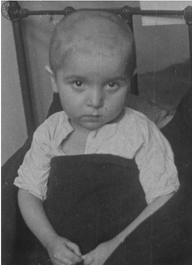
Dziecko z Zamojszczyzny o nieznanym nazwisku sfotografowane w Warszawie w Zakładzie Fotograficznym p. Kończakowskiego, 1943 r.