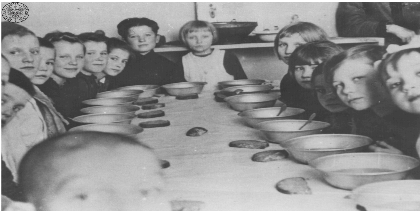
Dzieci z Zamojszczyzny w sierocińcu w Łaskarzewie, 1942-1943

https://przystanekhistoria.pl/pa2/tematy/zbrodnie-niemieckie/105393,Dzieci-w-bydlycych-wagonach.html