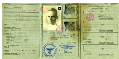
Kenkarta Witolda Pileckiego na nazwisko Smoliński.

Moment, w którym Pilecki mógł spokojnie opisać wszystko, co widział, nadszedł dopiero po wojnie, we Włoszech. Od 1943 r. żył w wirze spraw konspiracyjnych, służył w Kedywie, potem w Powstaniu Warszawskim dowodził jednym z oddziałów zgrupowania „Chrobry II” w tzw. Reducie Witolda. Z ruin stolicy wyszedł jako jeńiec, a do 2. Korpusu gen. Władysława Andersa dołączył w 1945 r. po wyzwoleniu przez Amerykanów z niemieckiego obozu w Murnau.