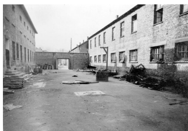
Mur ceglany na dziedzińcu bloku 11; po prawej przenośna szubienica, 1945 r.

Ci, dla których pracy zabrakło, byli zmuszani do „uprawiania gimnastyki”. „Niemożliwością było zrobić »żabkę« dookoła wielkiego placu – już nie dlatego, że w drewniakach, bo się je brało wtedy w ręce, i nie dlatego, że boso po żwirze zdzierano się skórę ze stóp do krwi; lecz dlatego, że żadne mięśnie na taki wyczyn nie wystarczały. Tu znowu ratowała mnie zaprawa sportowa z lat przeszłych. Tu znowu wykańczano słabych inteligentów z brzuszkami, dla których niemożliwa była żabka nawet na krótkiej przestrzeni. Tu znowu kij spadał na głowy tych, co się co parę kroków przewracali. Znowu niemiłosierne kończenie ludzi. I znowu, jak zwierzę, człowiek korzystał z chwili wytchnienia i łapał oddech w momencie, gdy zgraja z kijami obskakiwała jakąś nową ofiarę” – tyle Pilecki.