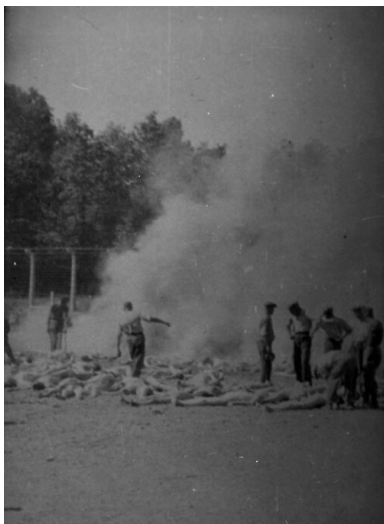
Palenie zwłok w KL Auschwitz.