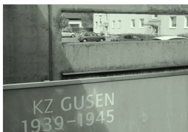
Widok przez mur obozu w Gusen