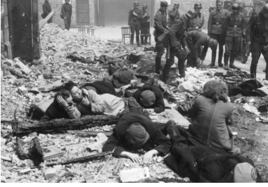
Grupa Żydów schwytyanych przez Niemców w czasie powstania w getcie warszawskim. Fotografia pochodzi z raportu Stroopa.