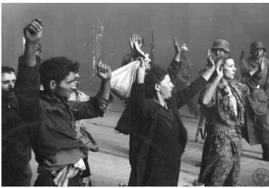
Żydzi schwytni przez Niemców w czasie powstania w getcie warszawskim. Fotografia pochodzi z raportu Stroopa.

Getto w Warszawie dla ludności żydowskiej zostało utworzone przez władze niemieckie 2 października 1940 r., a zamknięte 16 listopada tego roku. W szczytowym momencie przebywało w nim ok. 450 tys. osób. Głód, przeludnienie, ciężkie warunki bytowe i choroby powodowały wysoką śmiertelność. W 1942 r., w dniach od 22 lipca do 21 września, Niemcy przeprowadzili pierwszą wielką akcję likwidacyjną, w wyniku której wywieziono do Treblinki i zamordowano ok. 265 tys. Żydów, a ok. 10 tysięcy zabito na miejscu. W getcie szczątkowym pozostało ok. 70 tys. osób. Drugą akcją wysiedleńczą Niemcy zorganizowali w dniach od 18 do 21 stycznia 1943 r. W jej wyniku do Treblinki wywieziono ok. 5 tys. osób. Akcja wywołała zbrojny opór i została przerwana.