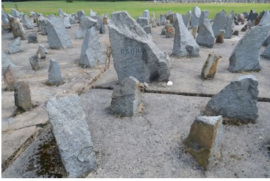
Kamień upamiętniający radomskich Żydów na terenie niemieckiego obozu zagłady w Treblince