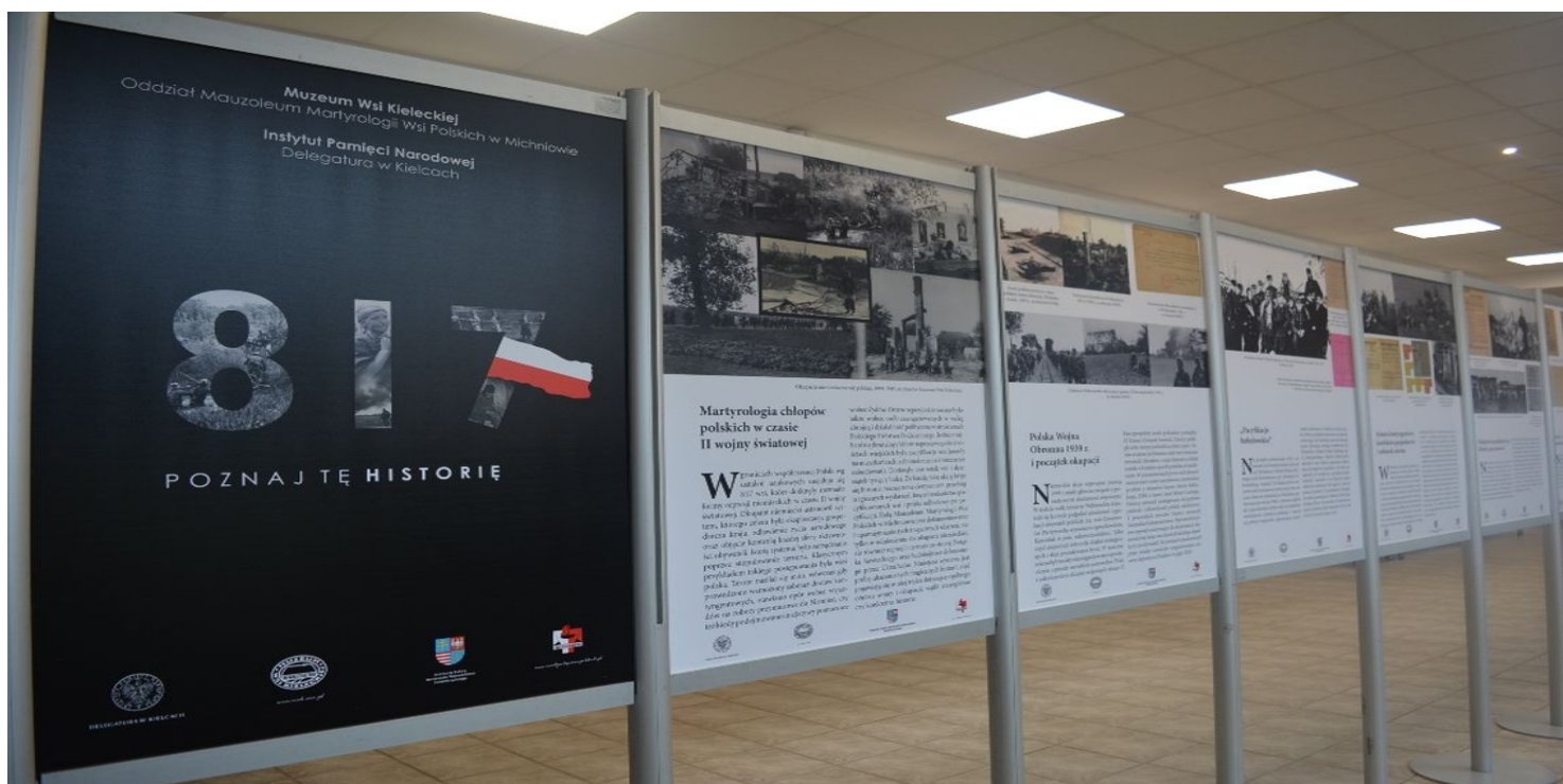
Wystawa „817. Poznaj tę historię” w Centrum Edukacyjnym „Przystanek Historia” IPN w Kielcach – czerwiec, lipiec 2018

https://przystanekhistoria.pl/pa2/tematy/zbrodnie-niemieckie/77522,Prowadzilem-sledztwo-w-sprawie-pacyfikacji-Michniowa.html