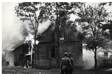
Płonący Michniów, 12 lipca 1943