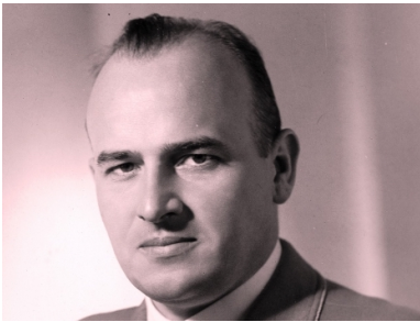
Hans Frank (1900-1946)

Ważnym dodatkowym aspektem przedsięwzięcia z punktu widzenia Niemców była stała kontrola nad młodymi Polakami, którzy mogliby prowadzić działalność konspiracyjną. Ponadto do przeprowadzenia planowanych inwestycji budowlanych, remontów dróg i linii kolejowych, regulacji rzek, melioracji i wzniesienia nowych budynków potrzebne były Frankowi dobrze zorganizowane oddziały tanich pracowników.