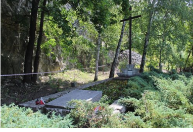
Zbiorowa mogiła polskich więźniów obozu „Liban”