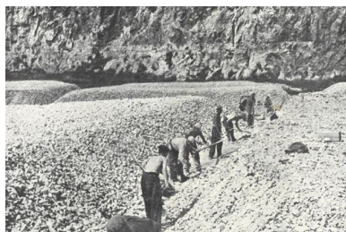
Łamanie i obróbka kamienia

Struktura organizacyjna była dostosowana do administracji GG. Liczba junaków w najmniejszych komórkach Baudienstu wahała się między 100 a 600. Stanowiska kierownicze w zasadzie zawsze obsadzali Niemcy, a podrzędne funkcje pełnili Polacy. Junacy byli wykorzystywani do prac fizycznych, pomocy w rolnictwie oraz usuwaniu skutków klęsk żywiołowych. Zdarzało się, że byli zmuszani do kopania grobów dla ofiar Holokaustu lub masowych egzekucji.