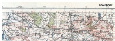
Fragment mapy Lasu Węteckiego (PAS 47 SŁUP 31), skala 1-100 000, Warszawa 1938