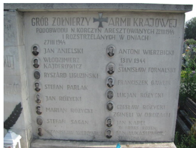
Grób żołnierzy Podobwodu AK Nowy Korczyn