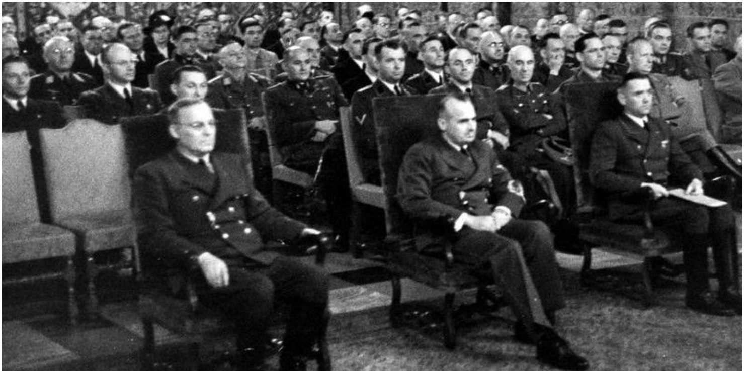
Uroczystość nazistowska w jednej sal zamku na Wawelu

https://przystanekhistoria.pl/pa2/tematy/zbrodnie-niemieckie/81548,Hans-Frank.html