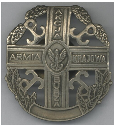
Pamiątkowa odznaka „Akcja Burza”.