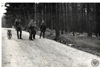
Niemcy z aresztowanymi mieszkańcami wsi, Michniów, 12

Wobec mieszkańców wsi w okresie II wojny światowej zastosowano także inne formy represji za bierny opór, udzielanie pomocy Żydom, nielegalny handel czy pomoc partyzantce. W niewielkim natomiast stopniu wieś kielecką dotknęły wysiedlenia na wzór Zamojszczyzny. Usuwanie z gospodarstwa jako element represji za niewywiązywanie się z dostaw, administracja okupacyjna zastosowała na większą skalę w okresie wzmożonej eksploatacji wsi. Podstawowy środek represji stanowiły areszty, więzienia i obozy.