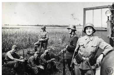
...w Michniowie, 12 VII 1943 r. Fot. z zasobu IPN