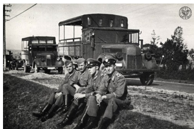
Niemcy przed akcją...