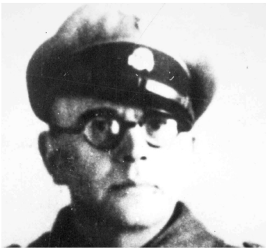
Gestapowiec Franz Schmidt

W niedzielę 7 marca okupanci dokonali masowego mordu w miejscowości Kaszyce. Zabili 112 mieszkańców wsi (w tym 27 dzieci) i kilka osób z okolicznych miejscowości. Po kolejnej wieczornej libacji, w poniedziałek 8 marca wybrali się do miejscowości Rokietnica, gdzie zamordowali 45 osób, i do Czelatyc – tam zgładzili 15 osób. Ogółem w ciągu trzech dni niemieccy oprawcy zamordowali ponad 220 Polaków.