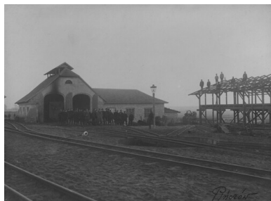
Stacja kolejowa w Pińczowie.

Należy pamiętać, że z Buska-Zdroju nie odchodziły bezpośrednio transporty do obozów koncentracyjnych. Osoby osadzone w więzieniach na terenie stolicy Kreishauptmannschaftu w tym celu przewożono do Pińczowa. Według książki ewidencyjnej aresztu powiatowego w Busku-Zdroju prowadzonej w latach 1941-1944, 559 osób odesłano do więzienia w Pińczowie. Stamtąd więźniów najczęściej wywożono do KL Auschwitz-Birkenau.