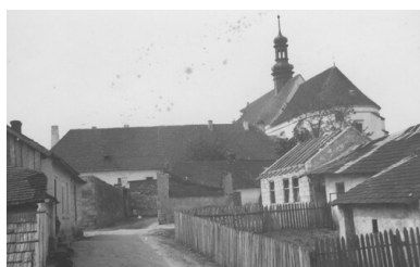
Pińczów, okres wolnej Polski (1918 - 1939). W tle widoczny kościół Nawiedzenia Najświętszej Maryi Panny (dawny kościół i klasztor Reformatów).